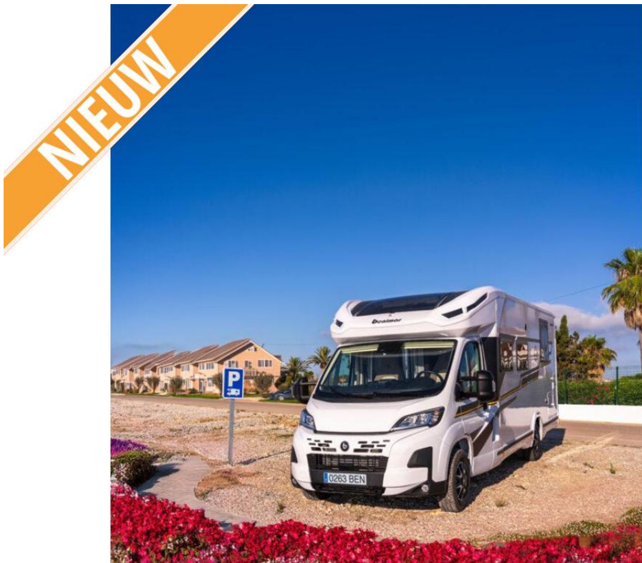
Benimar Mileo Mileo 263