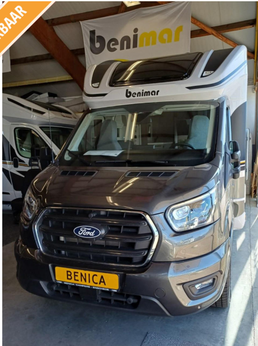
Benimar Tessoro Tessoro 425